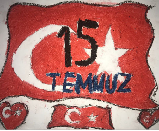
Elif Ayşe DÖNMEZ 4/C