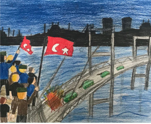
Ece YILMAZ 4/C