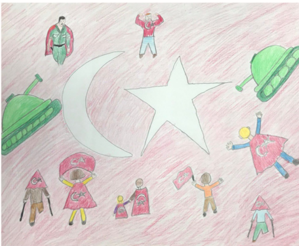
Özge ATAĞ 4/A