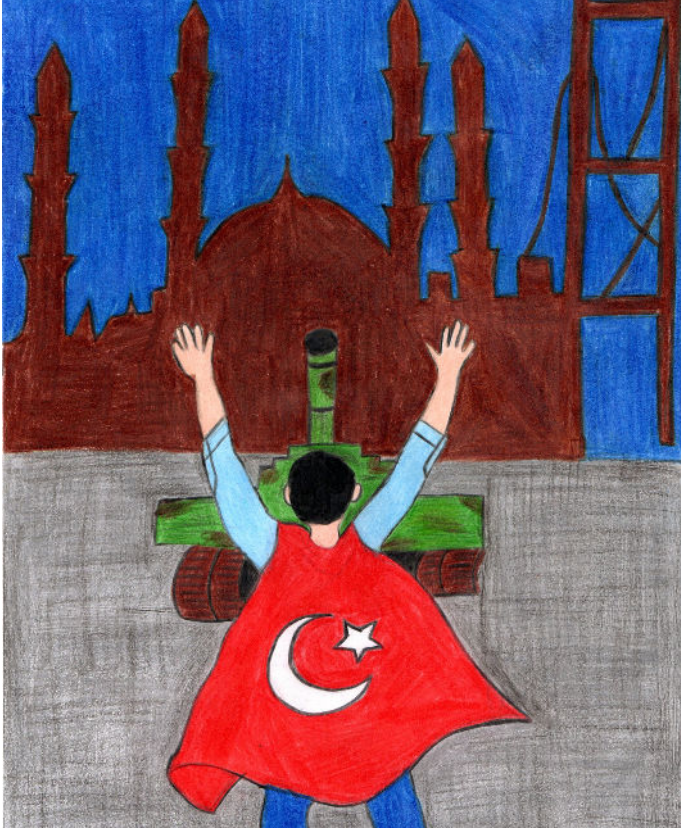
Beyza GÜLNAR 4/A