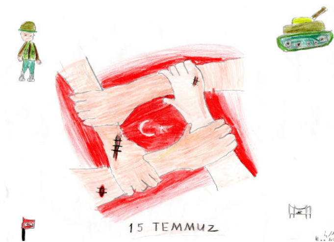
Alya ARSLAN 4/A