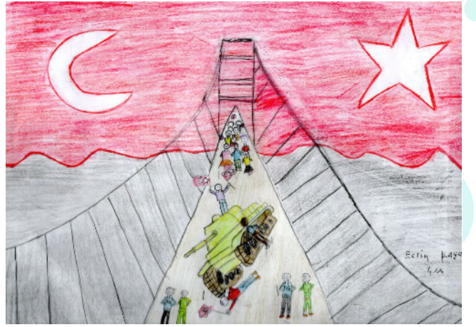
Ecrin KAYA 4/A