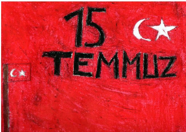
Yasin TAŞKIN 3/B