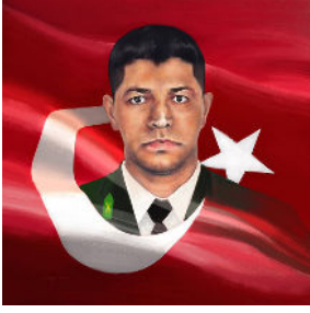
Darbe Girişiminde İlk Kurşunu Sıkan Şehit Astsubay Kıdemli Başçavuş Ömer HALİSDEMİR