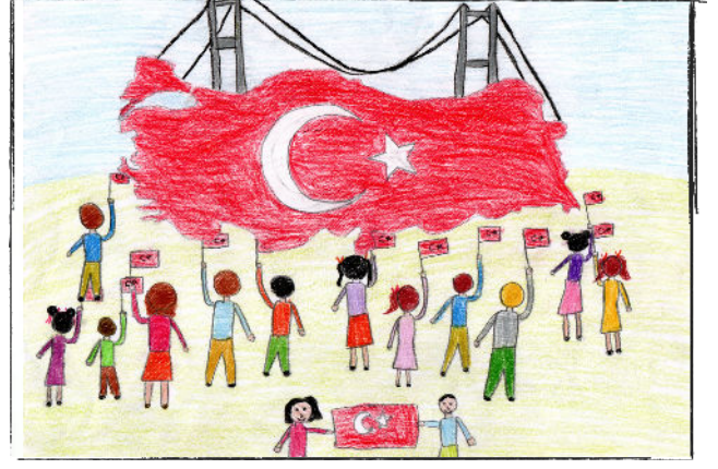
Aslı DİRİK 4/A