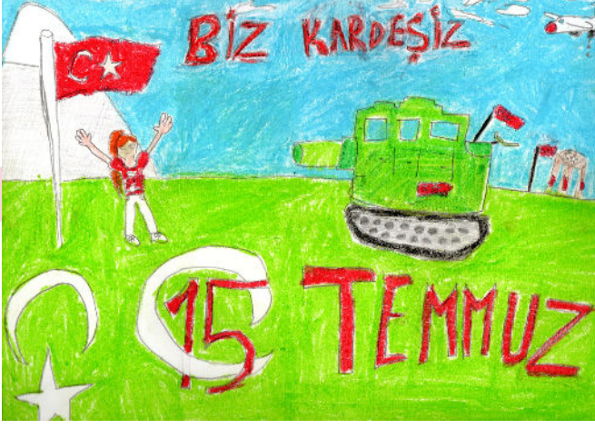
Merve CEYLAN 3/B